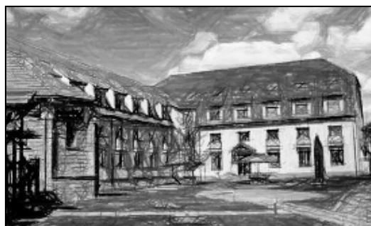
Jakab Antal Ház