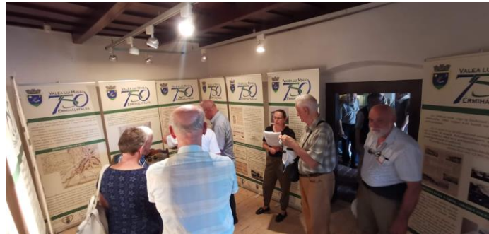
Érmihályfalva: Dr. Andrassy Ernő Történelmi és Néprajzi Városi Múzeum