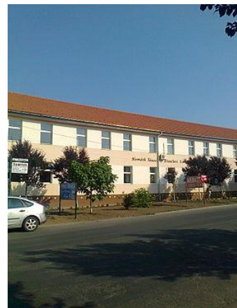
Horváth János Elméleti Líceum