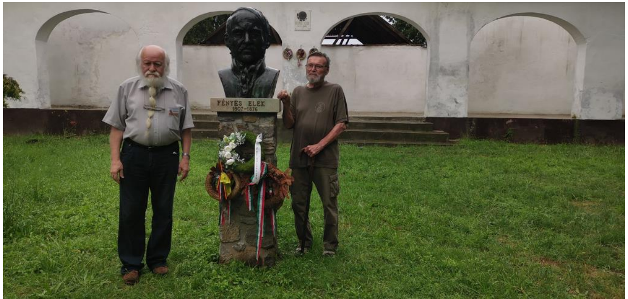
Fényes Elek szobrának megkoszorúzása