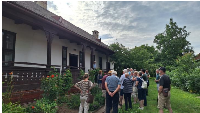
Mezőpetri: Sváb tájház