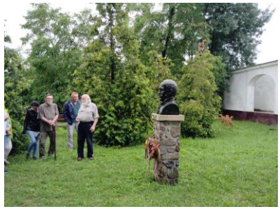
Csokaj: Fényes-kúria Fényes Elek szobrával