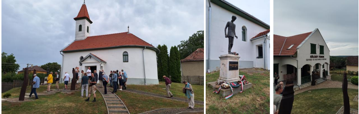
Sződemező: református templom, Kölcsey-szobor, kulturális központ