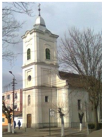
Margitta: Római katolikus templom