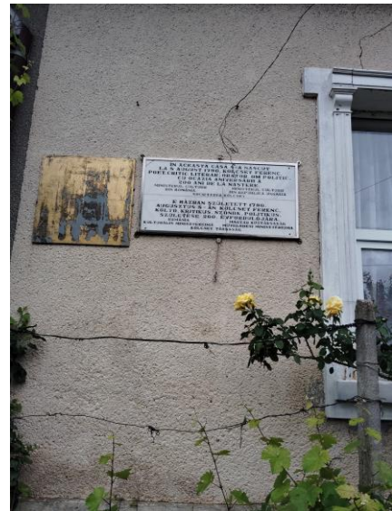
Sződemező: Kölcsey Ferenc szülőháza kétnyelvű emléktáblával (ma görög katolikus parókia)