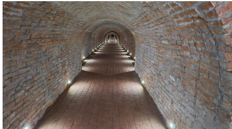
Ottomány: Komáromy-kúria és a vizespince