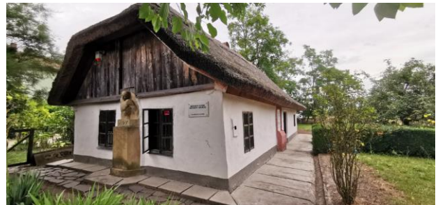
Érdmindszent: Ady-kúria (1907) és Ady Endre szülőháza