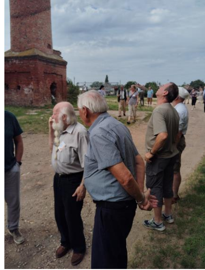
Érmihályfalva: Gizella Művelődési Központ (egykor Gizella-malom)