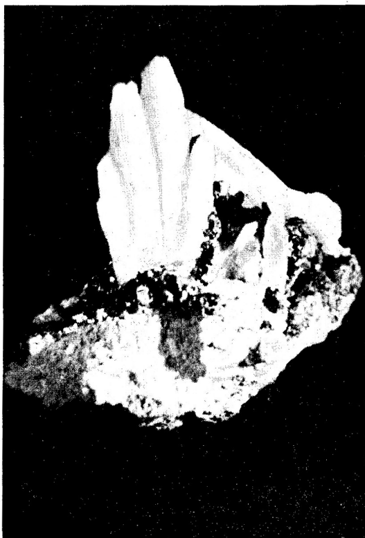
Cuarț cu galenit și blendă de la Capnic (reg. Baia Mare)

Așa de exemplu, din grupul oxizilor , numai genul cuarț , cu rudele sale cele mai apropiate, figurează în colecție cu nu mai puțin de 428 de piese. Acestui gen îi aparțin însă, ce-i drept, minerale atât de deosebite prin splendoarea formelor și culorilor lor, cum sînt bunăoară cristalul de stîncă , transparent și clar ca apa (de ex. din Săcărimb, Baia de Arieș, Boița, Roșia Montană, Rodna, Ojdula, Capnic etc.), ametistul , în nuanțele lui cele mai fine de violet (de ex. din Roșia Montană, Boița, Mățești, mai ales însă din mina „Barbara“, de lângă Porcurea, renumită prin frumusețea cristalelor ei), — apoi frumoasele calcedonii (de ex. din Tătărăștii de Criș, Boița, Techereu, Roșia Montană, Aciuța, Trestia, Capnic), agate (din Tătărăștii, Techereu, Aciuța) și opaluri (din Lueta, Aciuța, Crăciunești, Basarabasa).