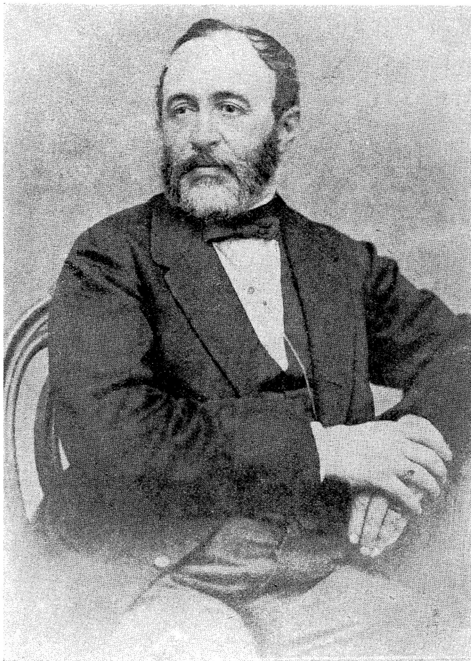
Franz Josef Müller von Reichenstein (1740—1825) descoperitorul elementului telur